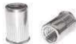
Ecrou crante a sertir inox A2 tête fine affleurante ref 26272 Inox A2