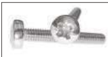
Vis tête cylindrique TC PZ DIN 7985 ref 24102 Inox A2, A4