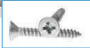
Vis tole inox tête fraisée pozidriv TF PZ DIN 7982 Z ref 28092 Inox A2, A4