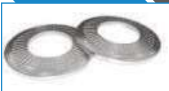
Rondelle contact large L 25511 ref 27212 Inox A2, A4