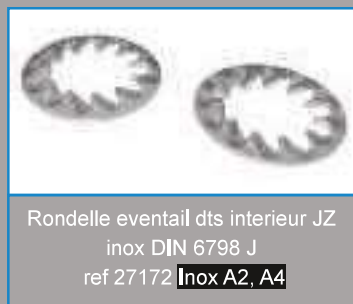
Rondelle éventail dts intérieur JZ inox DIN 6798 J ref 27172 Inox A2, A4