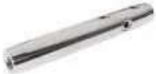
Serre cable filetage interne pas a droite ou a gauche ref 33442 Inox A4