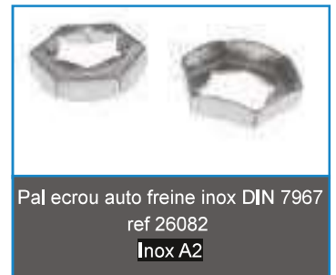
Pal ecrou auto freine inox DIN 7967 ref 26082 Inox A2