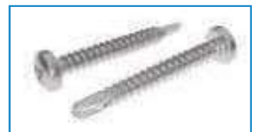
Vis autoperceuse inox tête cylindrique empreinte Pozidriv DIN 7504 ref 28191 Inox A2, C1