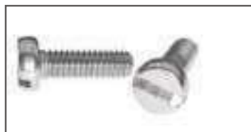
Vis tête cylindrique large fendue inox TCF DIN 85 ref 24092 Inox A2, A4