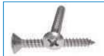
Vis tole tete fraisée bombée empreinte Phillips TFB PH ref 28142 Inox A2