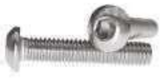
Vis tête bombée 6 pans creux TB 6PC inox DIN 7380 ref 25052 Inox A2, A4