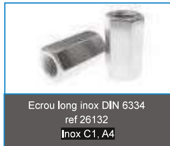
Ecrou long inox DIN 6334 ref 26132 Inox C1, A4