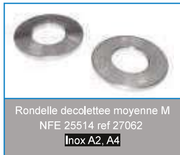
Rondelle decolettee moyenne M NFE 25514 ref 27062 Inox A2, A4