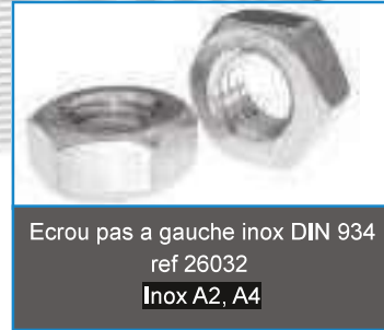
Ecrou pas a gauche inox DIN 934 ref 26032 Inox A2, A4