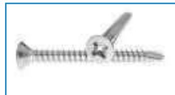
Vis autoperceuse tête fraisée empreinte Pozidriv DIN 7504 ref 28222 Inox A2