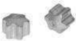
Embout Etoile de scellement pour empreinte Torx ref 30120 Acier