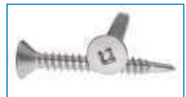
Vis autoperceuse tête fraisée empreinte Carrée DIN 7504 ref 28231 Inox A2, C1