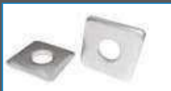
Rondelle carree DIN 436 ref 27312 Inox A2