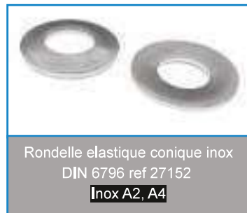
Rondelle élastique conique inox DIN 6796 ref 27152 Inox A2, A4