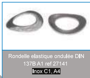
Rondelle élastique ondulée DIN 137B A1 ref 27141 Inox C1, A4