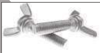
Vis a oreille inox forme americaine DIN 316 Vis violon ref 24182 Inox A2