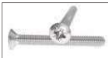
Vis tête fraisée bombée TFB inox Pozidriv DIN 966 ref 24072 Inox A2