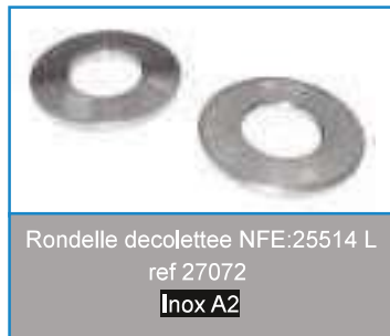
Rondelle decolettee NFE:25514 L ref 27072 Inox A2