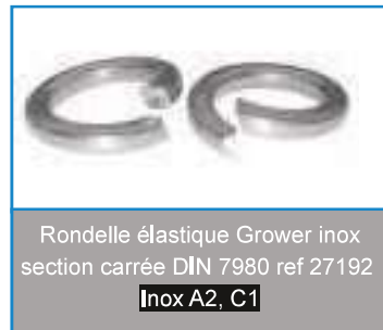
Rondelle élastique Grover inox section carrée DIN 7980 ref 27192 Inox A2, C1