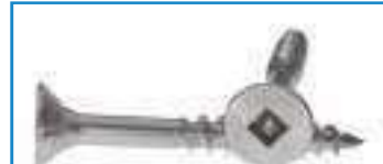
Vis bois inox tête fraisee empreinte carree ref 29082 Inox A2