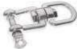
Emerillon a anneau avec manille ref 33332 Inox A4