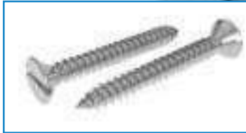
Vis inox tôle tête fraisée fendue TFF DIN 7972 ref 28022 Inox A2, A4