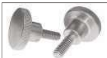
Vis molette type haut inox A1 DIN 464 ref 24152 Inox C1