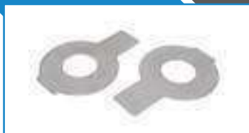
Frein d'ecrou droit a aileron inox NFE 25540 ref 27272 Inox A2