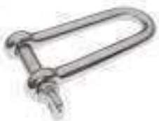
Manille droite forgee longue ref 33292 Inox A4