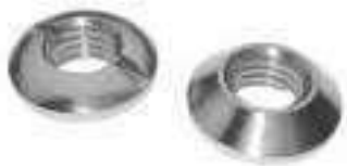
Ecrou fraisé bombé ref 25052 Inox A4