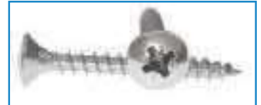
Vis bois tête fraisee bombee pozidrive TFB PZ ref 29122 Inox A2