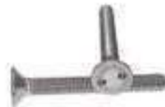
Vis antivol inox tête fraisée inviolable Snake Eyes ref 30032 Inox A2