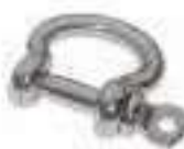
Manille droite forgee ref 33302 Inox A4