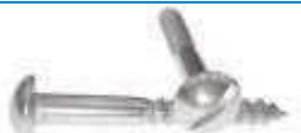
Vis bois inox tête ronde fendue TBF DIN 96 ref 29022 Inox A2, A4