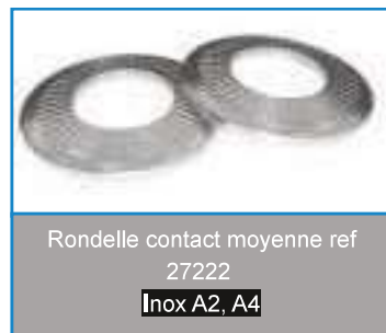
Rondelle contact moyenne ref 27222 Inox A2, A4