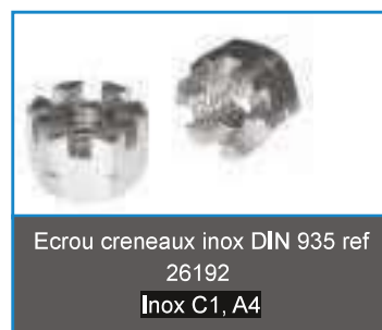
Ecrou creneaux inox DIN 935 ref 26192 Inox C1, A4