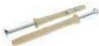
Vis TC inox tête cylindrique torx DIN 7985 Cheville à frapper ref 26470 Inox A2