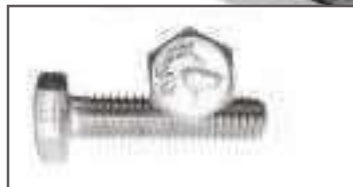
Vis TH inox tête hexagonale filetage complet DIN 933 ref 24012 Inox A2, A4, A4-80