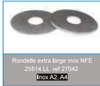
Rondelle extra large inox NFE 25514 LL ref 27042 Inox A2, A4