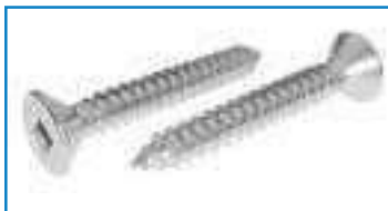
Vis tole tête fraisée empreinte carrée ref 28122 Inox A2