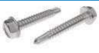
Vis tole auto perceuse inox tête hexagonale à embase TH DIN 7504 K ref 28172 Inox A2