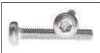
Vis TC inox tête cylindrique torx DIN 7985 ref 24112 Inox A2, A4