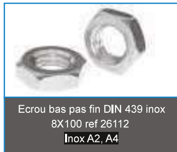
Ecrou bas pas fin DIN 439 inox 8X100 ref 26112 Inox A2, A4