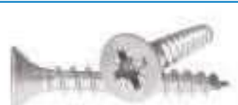
Vis agglo inox tête fraisee Pozidriv filetage complet VBA PZ FC ref 29052 Inox A2, A4