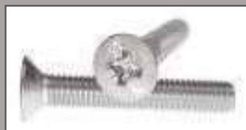
Vis auto taraudeuse DIN 7500 MZ tête fraisée pozidrive ref 24172 Inox A2