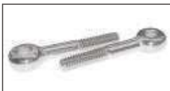
Vis a oeil inox DIN 444 B ref 24142 Inox A2, A4