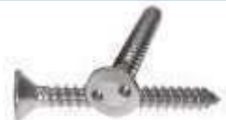
Vis antivol inox tôle tête fraisée inviolable Snake Eyes ref 30082 Inox A2