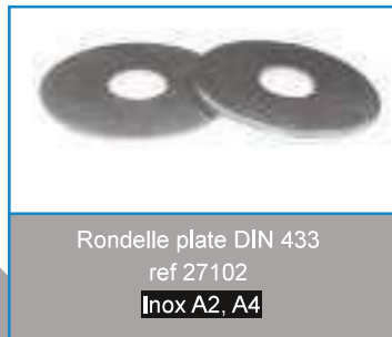
Rondelle plate DIN 433 ref 27102 Inox A2, A4