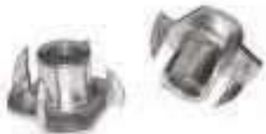
Ecrou a griffe ref 26432 Inox A2