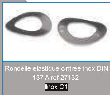
Rondelle élastique cintree inox DIN 137 A ref 27132 Inox C1