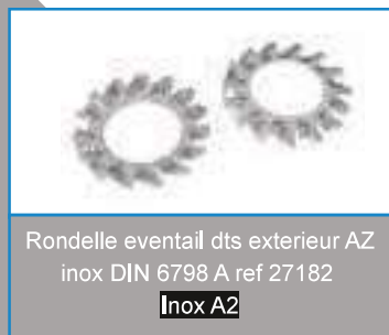
Rondelle éventail dts extérieur AZ inox DIN 6798 A ref 27182 Inox A2