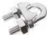
Serre cable etrier ref 33102 Inox A4