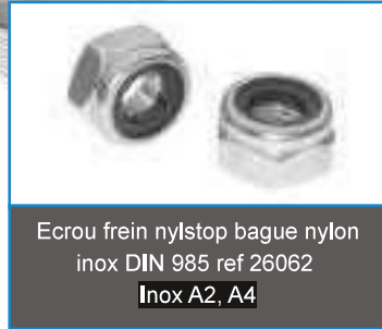
Ecrou frein nylstop bague nylon inox DIN 985 ref 26062 Inox A2, A4