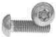
Vis inox métaux tête bombée six lobes Torx inviolable avec téton central ref 30052 Inox A2