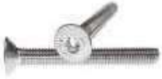
Vis métaux tête fraisee 6 pans creux TFHC inox DIN 7991 ref 25042 Inox A2, A4