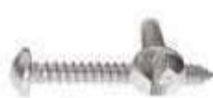
Vis tole one way tete cylindrique inox ref 30112 Inox A2