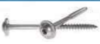
Vis charpente tête large inox ref 29222 Inox A2