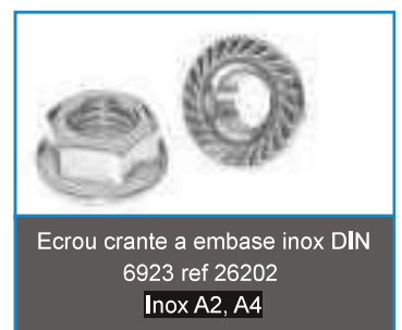
Ecrou crante a embase inox DIN 6923 ref 26202 Inox A2, A4