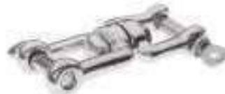
Emerillon a manilles ref 33342 Inox A4