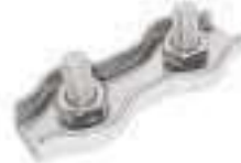
Serre cable double ref 33122 Inox A4