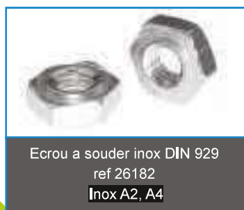
Ecrou a souder inox DIN 929 ref 26182 Inox A2, A4