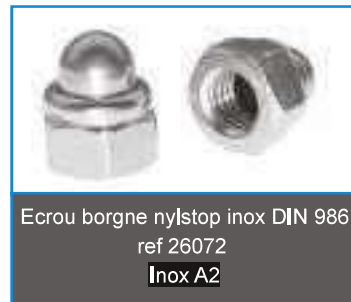
Ecrou borgne nylstop inox DIN 986 ref 26072 Inox A2