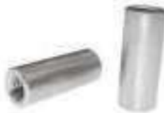
Manchon cylindrique taraude ref 26282 Inox A2, A4