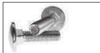
Vis tête ronde collet carré inox TRCC DIN 603 ref 24122 Inox A2, A4