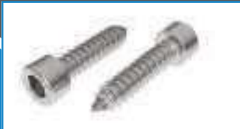
Vis tole TC inox tete cylindrique hexagonale 6 pans creux ref 28342 Inox A2