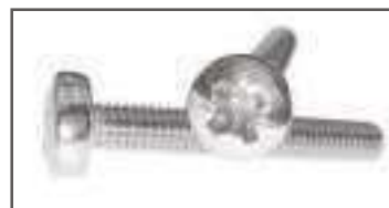
Vis autotaraudeuse DIN 7500 CZ tête cylindrique pozidrive ref 24162 Inox A2