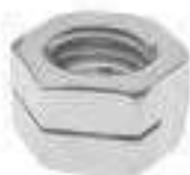
Ecrou fendu simple fente ref 26502 Inox A2, A4