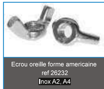
Ecrou oreille forme americaine ref 26232 Inox A2, A4