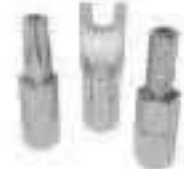
Embout de vis antivol à associer à nos vis inviolables inox ref 30000 Acier