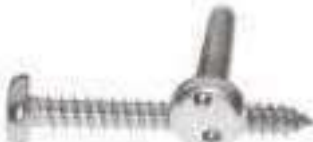
Vis antivol inox tôle tête cylindrique inviolable Snake Eyes ref 30102 Inox A2