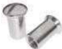
Ecrou relieur fraise bombe fendu ref 26262 Inox A2