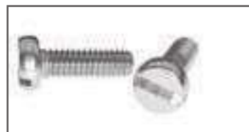
Vis tête cylindrique fendue inox TCF DIN 84 ref 24082 Inox A2, A4