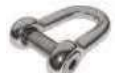
Manille droite forgee ref 33282 Inox A4