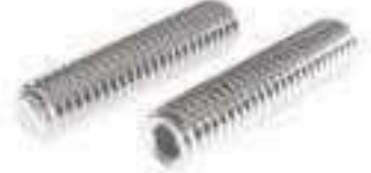
Vis sans tête STHC bout plat ISO 4026 ref 25072 Inox A2, A4