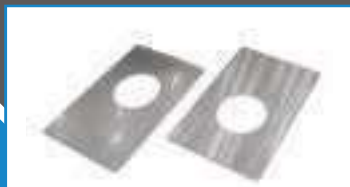
Frein d'ecrou rectangulaire inox NFE 25540 ref 27282 Inox A2