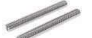
Vis STHC bout cuvette ISO 4029 CUV ref 25102 Inox A2, A4