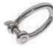
Manille torse forgee ref 33312 Inox A4