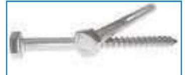
Vis bois inox tête hexagonale tirefond TH DIN 571 ref 29042 Inox A2, A4