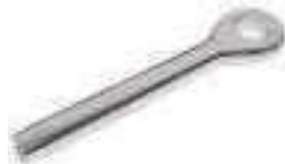
Embout a oeil a sertir ref 33552 Inox A4