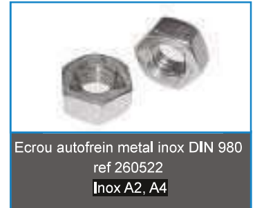
Ecrou autofrein metal inox DIN 980 ref 260522 Inox A2, A4