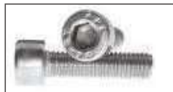
Vis tête cylindrique 6 pans creux TCHC inox DIN 912 ref 25012 Inox A2, A4, A4-80