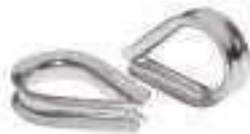
Cosse coeur ref 33082 Inox A4