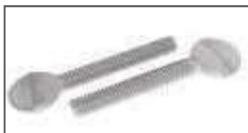
Vis violon ref 24200 Inox A2