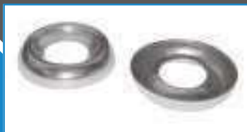
Rondelle cuvette emboutie ref 27232 Inox A2