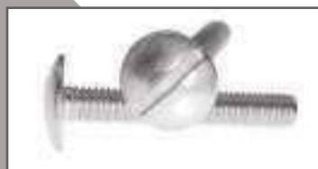
Vis poëlier fendue inox NFE 25129 ref 24132 Inox A2, A4