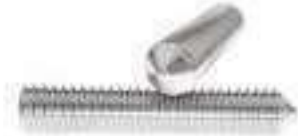
Vis STHC hexagonal 6 pans creux Pointeau DIN914 ref 25082 Inox A2, A4