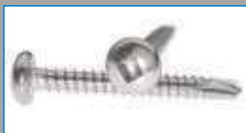
Vis autoperceuse inox tête cylindrique empreinte Carrée DIN 7504 ref 28201 Inox A2, C1