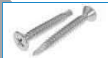
Vis tôle auto perceuse tete fraisee Phillips ref 28212 Inox A2