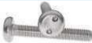
Vis inox métaux tête cylindrique inviolable Snake Eyes ref 30062 Inox A2