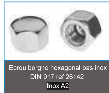
Ecrou borgne hexagonal bas inox DIN 917 ref 26142 Inox A2