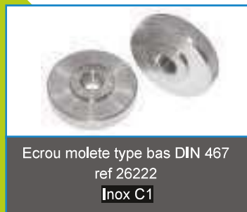
Ecrou molette type bas DIN 467 ref 26222 Inox C1