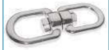
Emerillon a anneaux ref 25052 Inox A4