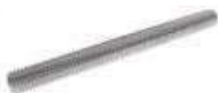
Tige filetée 1, 2 ou M (autres dimensions sur demande) ref 26292 Inox A2, A4