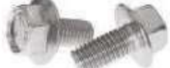
Vis tête hexagonale à embase TH DIN 6921 ref 24192 Inox A2, A4