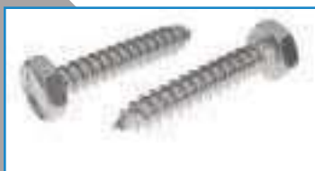
Vis TH inox tôle tête hexagonale bout pointu DIN 7976 ref 28152 Inox A2