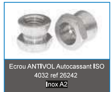
Ecrou ANTIVOL Autocassant ISO 4032 ref 26242 Inox A2