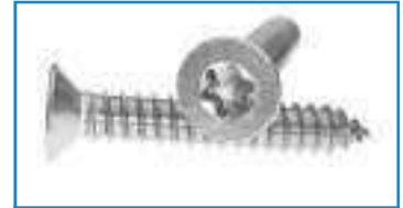
Vis tole tête fraisée empreinte Torx TF TX ref 28112 Inox A2, A4