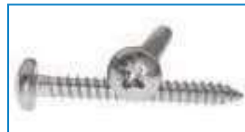
Vis tôle inox tête cylindrique pozidriv TC PZ DIN 7981 ref 28042 Inox A2, A4