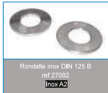
Rondelle inox DIN 125 B ref 27092 Inox A2