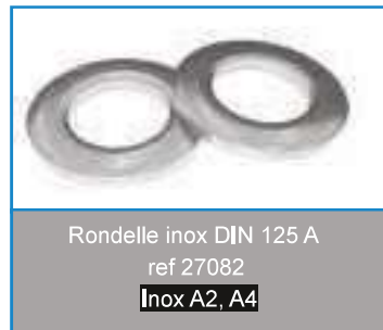
Rondelle inox DIN 125 A ref 27082 Inox A2, A4