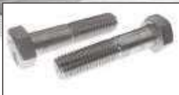
Vis tête hexagonale filetage partiel TH inox DIN 931 ref 24022 Inox A2, A4