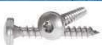
Vis bois inox tête cylindrique Torx VBA TC TX ref 29142 Inox A2, A4