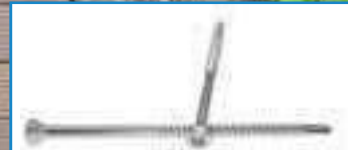
Vis bardage tête réduite ref 29462 Inox A2, A4