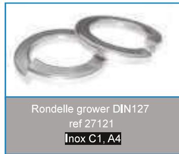
Rondelle grower DIN127 ref 27121 Inox C1, A4