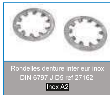
Rondelles denture intérieur inox DIN 6797 J D5 ref 27162 Inox A2