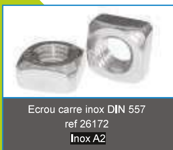
Ecrou carre inox DIN 557 ref 26172 Inox A2