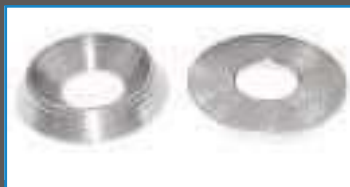
Rondelle cuvette decolettee ref 27242 Inox A2, A4