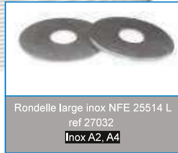
Rondelle large inox NFE 25514 L ref 27032 Inox A2, A4