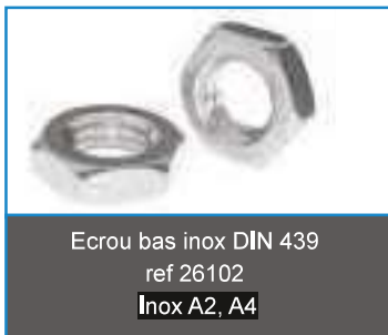
Ecrou bas inox DIN 439 ref 26102 Inox A2, A4