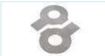
Frein d'ecrou equerre a aileron inox NFE 25540 ref 27262 Inox A2