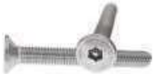
Vis TC inox tête cylindrique torx Vis anti vol inox tête fraisée six pans creux inviolable ref 30012 Inox A2