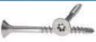
Vis bois autoperceuse tête fraisee Torx ref 29092 Inox A2