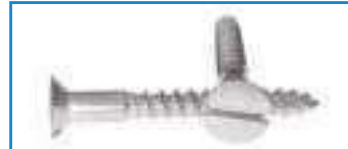
Vis bois inox tête fraisee fendue TFF DIN 97 ref 29032 Inox A2, A4