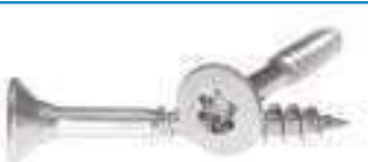
Vis bois inox tête fraisee Torx filetage partiel VBA TX FP ref 29072 Inox A2, A4