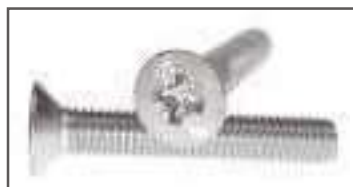
Vis tête fraisée pozidriv inox TF DIN 965 ref 24052 Inox A2, A4