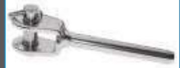
Embout chape a sertir inox cableref 33504 Inox A4