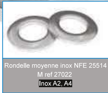
Rondelle moyenne inox NFE 25514 M ref 27022 Inox A2, A4