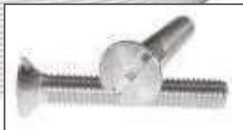
Vis TFF inox tête fraisée fendue DIN 963 ref 24032 Inox A2, A4