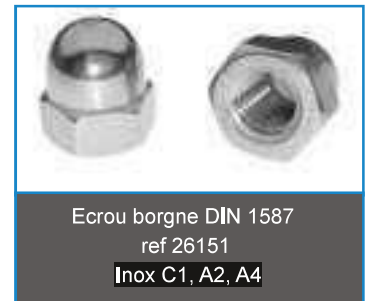
Ecrou borgne DIN 1587 ref 26151 Inox C1, A2, A4