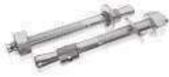
Goujon d'ancrage ETA-08 ref 26344 Inox A4