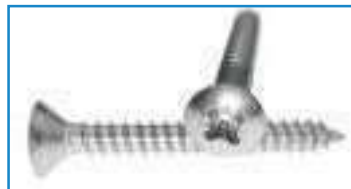
Vis tôle tête fraisée bombée empreinte Pozidrive TFB ref 28132 Inox A2, A4