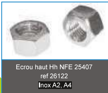
Ecrou haut Hh NFE 25407 ref 26122 Inox A2, A4