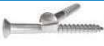
Vis bois inox tête fraisee bombee fendue TFBF DIN 95 ref 29012 Inox A2, A4