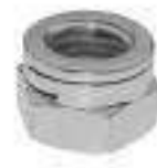
Ecrou fendu double fente ref 26582 Inox A2, A4