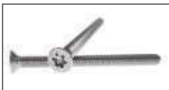
Vis inox tête fraisée torx TF DIN 965 ref 24062 Inox A2, A4