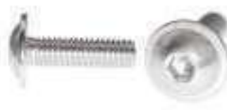
Vis tête bombée 6 pans creux a embase ref 25062 Inox A2, A4