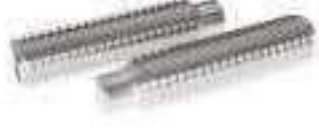
Vis STHC 6 pans creux hexagonal Teton long ref 25092 Inox A2