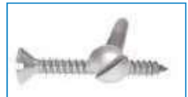
Vis inox tôle tête fraisée bombée fendue TFBF DIN 7973 ref 28032 Inox A2