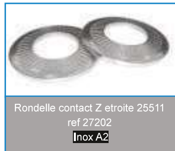
Rondelle contact Z étroite 25511 ref 27202 Inox A2