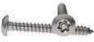
Vis anti vol inox tôle tête bombée six lobes Torx inviolable avec téton central ref 30092 Inox A2