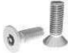
Vis antivol inox tête fraisée six lobes Torx inviolable avec téton central ref 30022 Inox A2