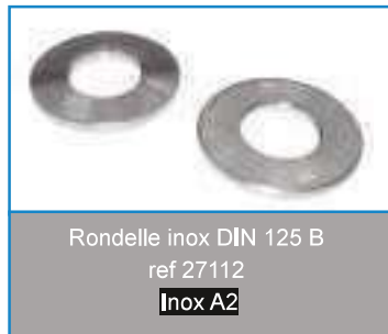
Rondelle inox DIN 125 B ref 27112 Inox A2