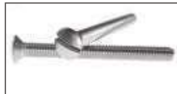
Vis tête fraisée bombée fendue inox DIN 964 ref 24042 Inox A2, A4