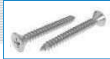
Vis tole tête fraisée empreinte phillips PH ref 28102 Inox A2, A4