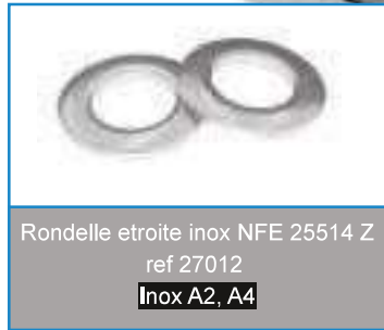
Rondelle étroite inox NFE 25514 Z ref 27012 Inox A2, A4