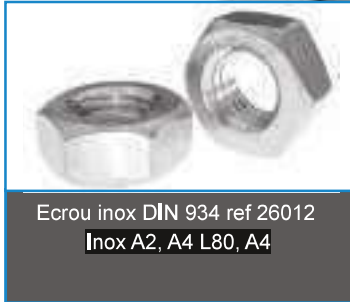
Ecrou inox DIN 934 ref 26012 Inox A2, A4 L80, A4